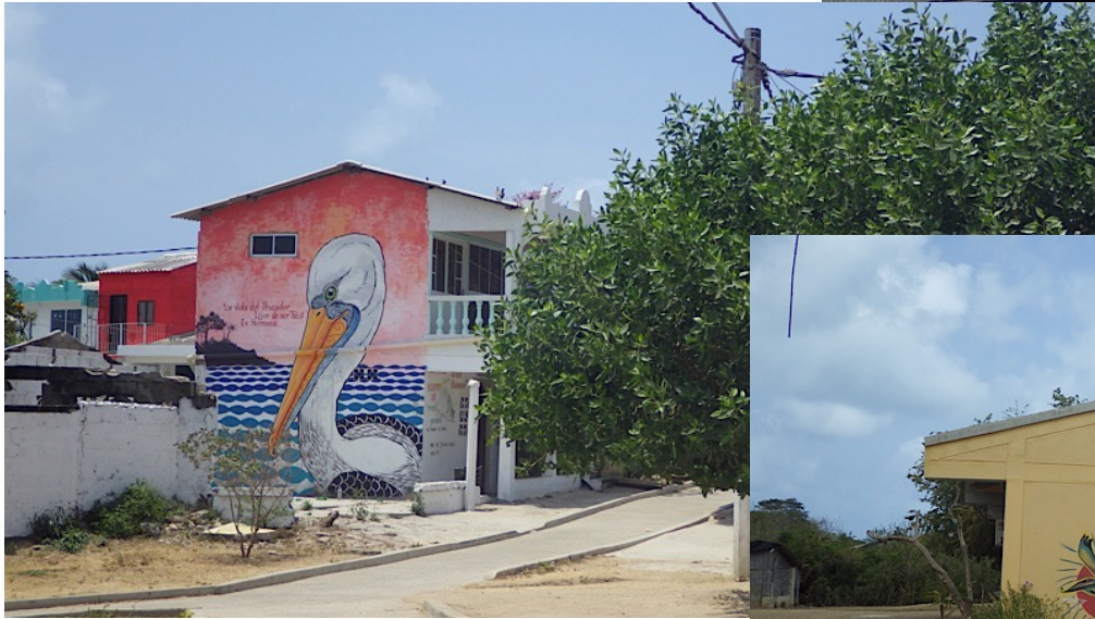
- Puerto Limon villaggio