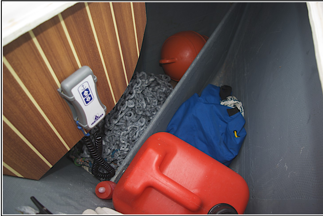
Baille et protection du guindeau.