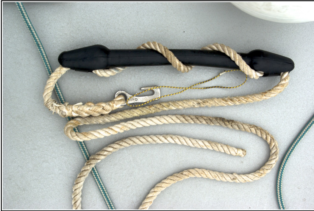
Main de fer avec amortisseur.