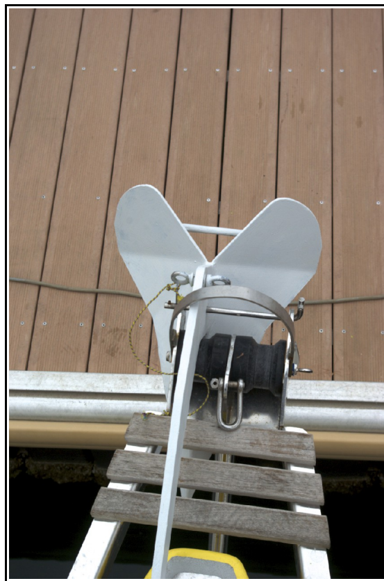
A poste, sous l'arceau qui évite à l'ancre de sortir du davier lors des remontées.